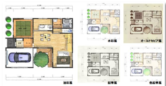
■各種表現もワンタッチで作成可能！