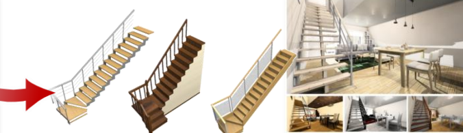
■思い通りの意匠設計も即作成可能！