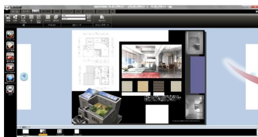
■オフィスライクの操作性を実現！