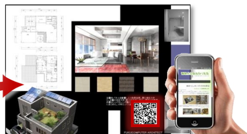
■スマートフォンと連携して提案可能！