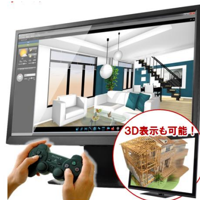
■モデル作成後に即ウォークスルー可能