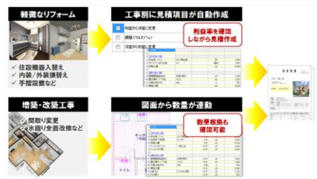
■リフォーム用途に応じて見積を即作成可能！